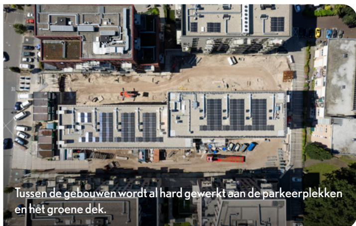
Tussen de gebouwen wordt al hard gewerkt aan de parkeerplekken en het groene dek.

Diependaalselaan en Van Ghentlaan) en Volante. De uitrit bevindt zich aan de andere zijde, tussen Volante en Rubina. Om de auto's aan het zicht te onttrekken, komt een dek dat we gaan beplanten. Zo ontstaat De Groene Duin: een glooiende groene buitenruimte.