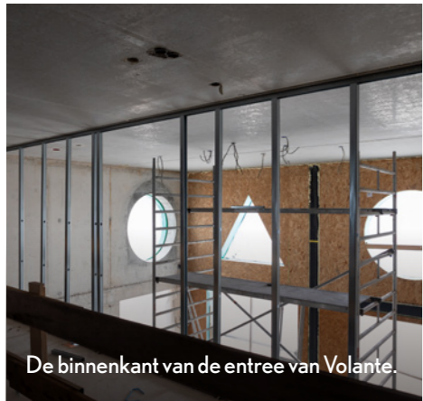
De binnenkant van de entree van Volante.

De vijf gebouwen van Nieuw Zuid zijn vernoemd naar lokale heideplanten. En net als deze planten, verschillen de gebouwen van vorm en kleur. Maar wel binnen het stedenbouwkundig plan voor heel Nieuw Zuid. Monadnock, het architectenbureau van Sandor, ontwierp Volante.