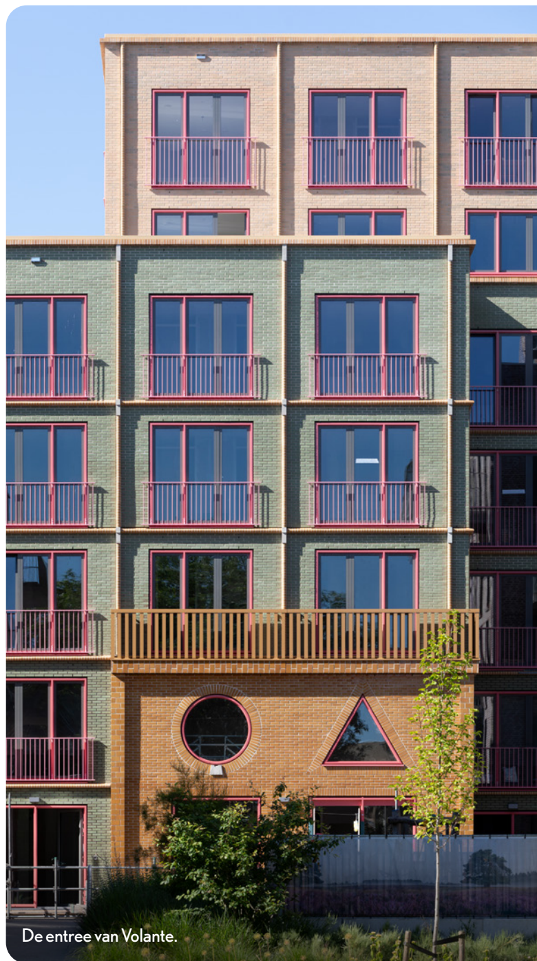
De entree van Volante.

Ook buiten gaat nog het een en ander veranderen. Wat nu nog een bouwplaats is, zal op den duur een fijne groene buitenruimte zijn voor bewoners en omwonenden. Het begint met het inrichten van parkeerplekken voor auto's. De toekomstige inrit van de parkeergarage is tussen gebouw Alba (op de hoek